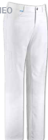
B7443323-001 B7405323-001 blanc blanc