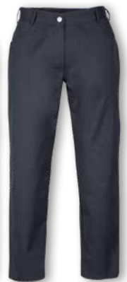
7908-001 7908-000 blanc noir